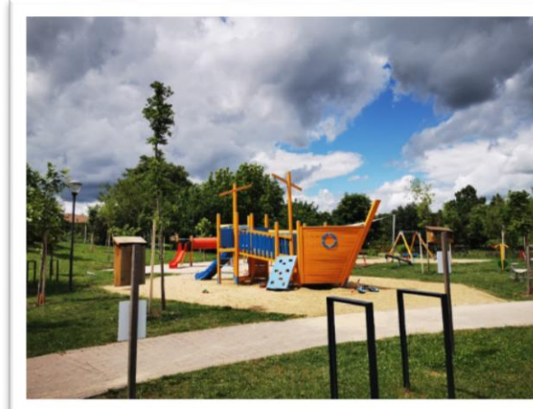
Milleniumi park játszótér