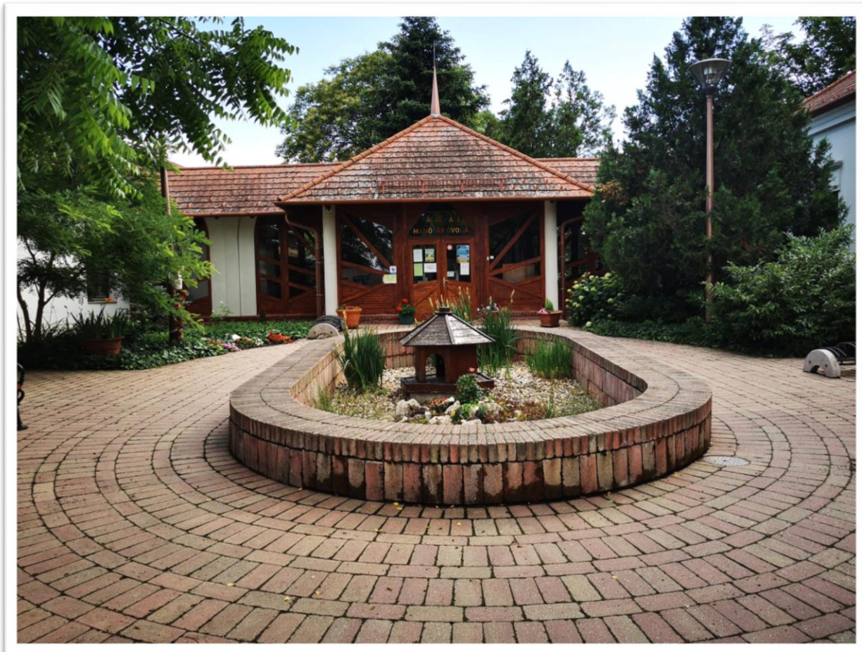
Rácalmási Manóvár Óvoda és Bölcsőde

Székhelye: 2459 Rácalmás, Szigetfő utca 17.