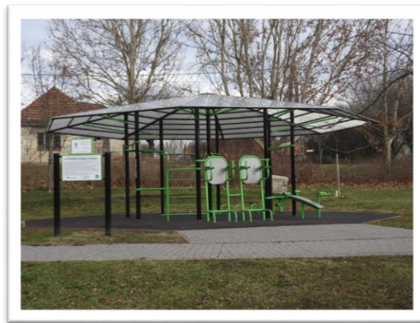
Milleniumi park Sportpark