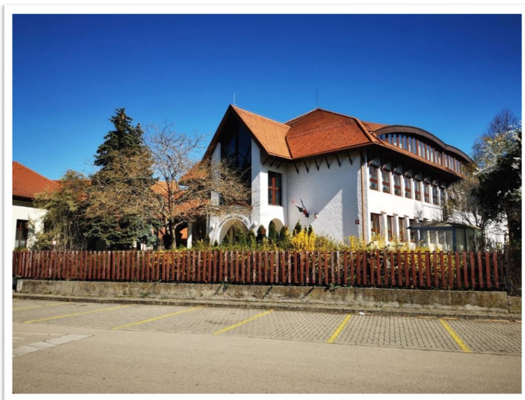
Rácalmási Jankovich Miklós Általános Iskola és AMI

(11) Az iskola a nappali rendszerű iskolai oktatásban, azokban az osztályokban és azokon a tanítási napokon, amelyekben közismereti oktatás is folyik, megszervezi a mindennapos testnevelést legalább napi egy testnevelésóra keretében, amelyből legfeljebb heti két óra váltható ki a sportról szóló törvény szerinti igazolt sportolói jogviszonyban álló versenyző tanuló kérelme alapján — versenyengedély birtokában — a sportszervezet keretei között szervezett edzéstáogatás igazolásával, amennyiben a testnevelésórát közismereti tanóra nem előzi meg, vagy nem követi.”