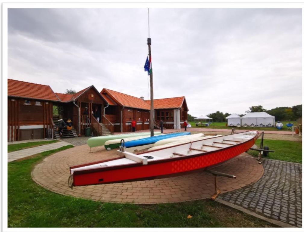
Vizi Gábor Vízitúra Megállóhely

A Vizi Gábor Vízitúra Megállóhelyet a Rácalmási Rendezvényközpont és Sportcsarnok üzemelteti. A mindennapokban a helyi sportegyesület vízi és szabadidősport szakosztálya használja a létesítményt, illetve a Sportcsarnok szervez ide programokat: osztálykirándulások, táborok, csapatépítők, családi összejövetelek színhelye a terület. Ezen felül sárkányhajózásra, valamint indiánkenu bérlésre, GPS túrázásra, kincskeresésre, kézműves foglalkozásokra van lehetőség.