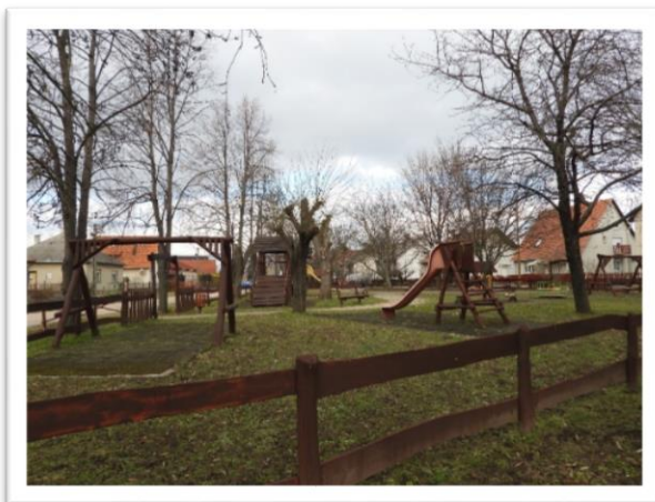
Móricz Zsigmond utcai játszótér

Az önkormányzat saját anyagi lehetőségeinek keretein belül, ill. pályázati támogatások felhasználásával dönt további új játszótérek létrehozásáról és a meglévők nagyobb arányú fejlesztéséről.