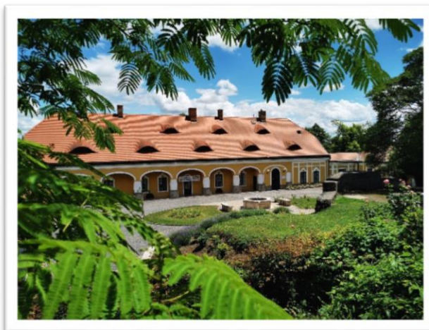
Jankovich-kúria Rendezvény- és Turisztikai Központ