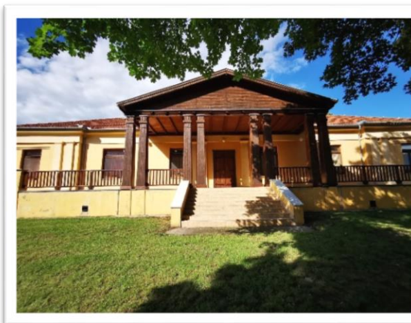
Rácalmási Művelődési Ház és Könyvtár