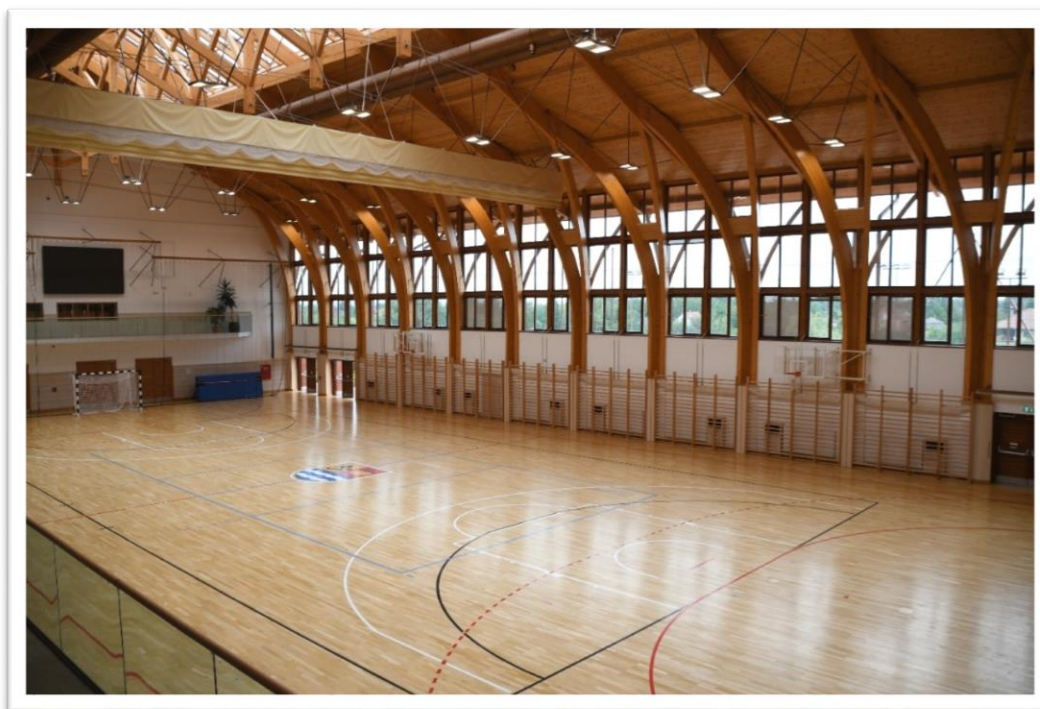
Rácalmási Rendezvényközpont és Sportcsarnok

A Rácalmási Rendezvényközpont és Sportcsarnokot aktuálisan kézilabda, teremlabdarúgás, futsal, téli kajak-kenu, kosárlabda, fitnessz, ultimate frizbi edzések, városi és egyedi rendezvények, sportos nyári táborok és edzőtáborok helyszíne.