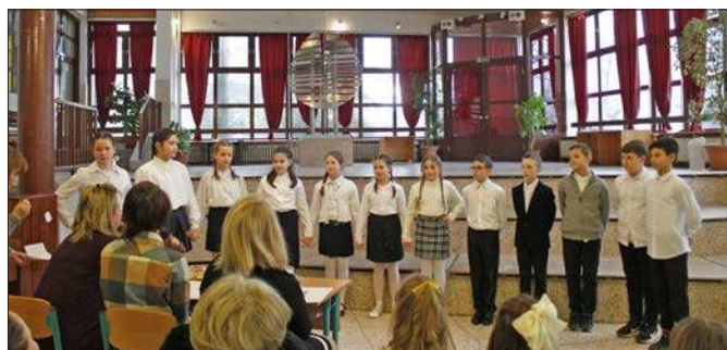
Énekes madarak – 4. évfolyam