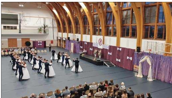
Pannon Oktatási Központ Gimnázium szalagavatója

Egyedi rendezvénynek sincs híján a Sportcsarnok küzdőtere: időrendi sorrendben a Pannon Oktatási Központ Gimnázium szalagavatója, a Jankovich Miklós Általános Iskola felsős farsangja, valamint Rácalmás Város Önkormányzatának nőnapj rendezvénye alkalmából kap védőszőnyeget és ünnepi díszet a küzdőtér.