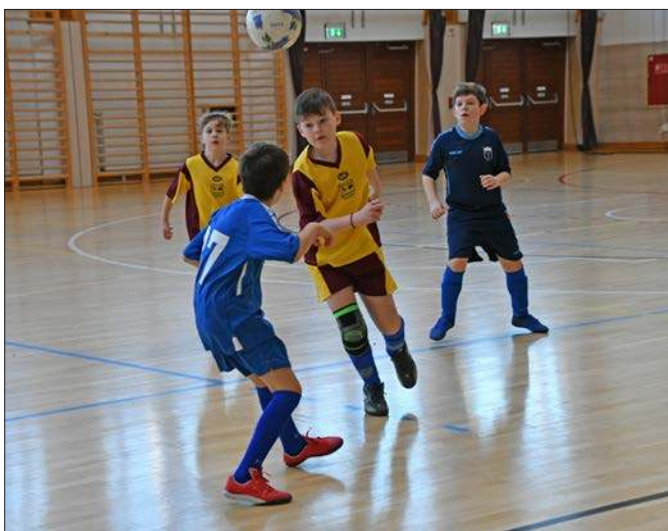
A RSE U11-es labdarúgó csapata a Kulcs SE által rendezett tornán, január 27-én