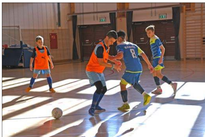
A RSE U15-ös labdarúgó csapata az RSE által rendezett futsal tornán, február 3-án