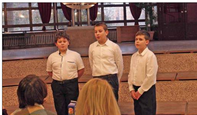
Rácalmási legények – 5. b