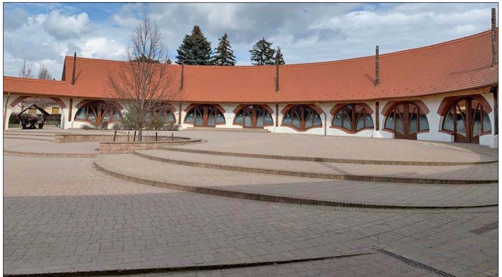
Egyik sikeres munkájuk a rácalmási általános iskola udvarának látványos térburkolata

A szakember annak idején közlekedésszervező mérnökként végzett az egyetemen, és ezt követően került vissza Dunaújvárosba dolgozni. A rendszerváltás után munkahelyét, az állami közútépítő vállalatot az elsők között privatizálták, s miután a főépítésvezetőként dolgozó fiatal mérnök a folyamatos átszervezések miatt már nem érezte jól magát a cégnél, 1993-ban döntött úgy, hogy vált. Előtte viszont számos