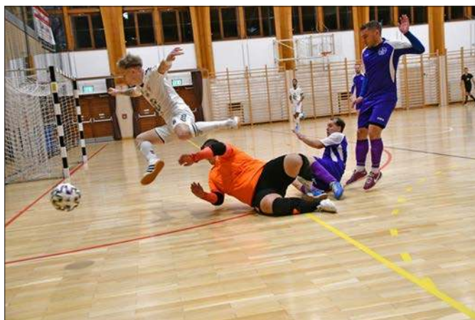
Futsal NBII – a Dunaújváros Futsal férfi csapata Rácalmásán játsszák bajnoki mérkőzéseiket. Itt az UTE csapata ellen január 26-án