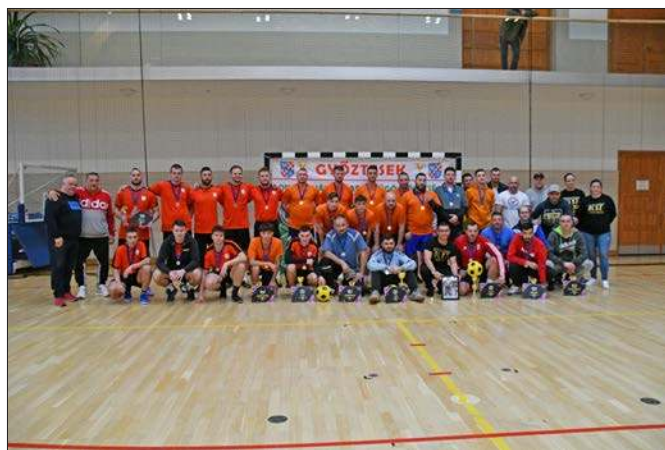
Dunaújvárosi Labdarúgó Szövetség Farsangi Teremlabdarúgótornája február 11-én