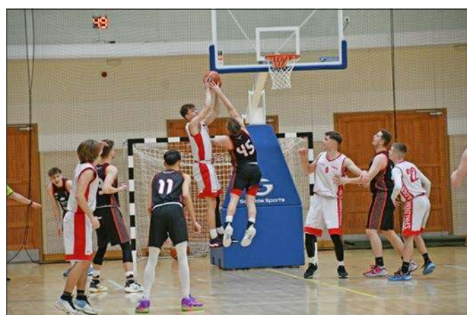
A Dunaújvárosi Dragons Kosárlabda SE U-23-as bajnoki mérkőzése február 10-én