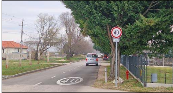
40-es tábla figyelmeztet a Venyimi úton. Ne nyomják padlógát a gázt, vegyék figyelembe a sebességkorlátozó táblát

Ebben az évben is pályázzunk Rácalmás Város Ön-