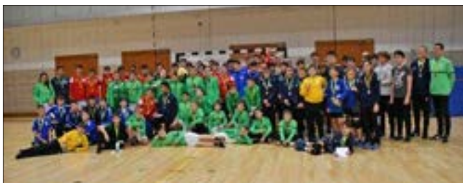
Üstökös Kupa első napjának érmes csapatai

A Rácalmási Sportcsarnok az Üstökös Kupa kézilabda utánpótlás torna fő helyszíne már több éve. A felkészülési tornát a Fejér Vármegyei Kézilabda Szövetség szervezi az őszi szünet környékén immár 19 éve. A versenyre az egész országból érkeznek csapatok, a Sportcsarnok a kupa hétvégén teltházzal működött.