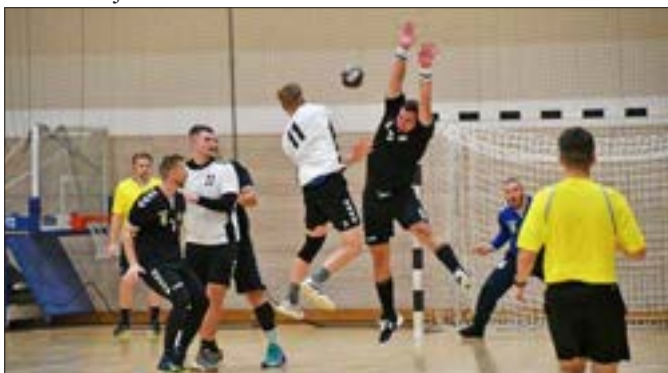
A felnőtt férfiak mérkőzésének pillanata

Az utánpótlás csapatok is maguk mögött tudhatnak néhány hétvégi fordulót. November és december folyamán még több korsztag hazai fordulóján lehet szurkolni a Sportcsarnok lelátóján!