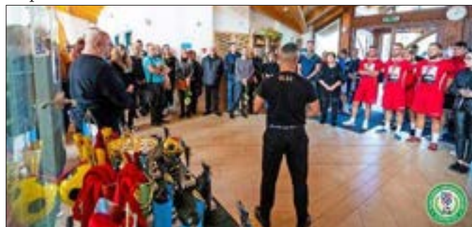
November 1-i DLSZ kupa pillanatai

A DLSZ már többször választotta tornái helyszínéül a Rácalmási Sportcsarnokot. Legutóbb november 1-én rendezett amatőr teremlabdarúgó emléktornát 8 férfi és 6 női csapat részvételével.