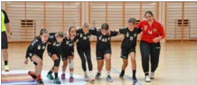
Az U13-as lány kézilabda csapat