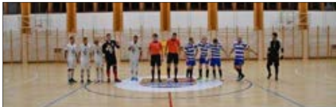
Férfi NB II. Dunaújváros Futsal