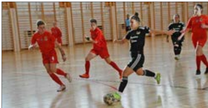
Női NB I. Dunaújváros Futball Club

A női NB I-ben játszó Dunaújváros Futball Club, valamint a férfi NB II-ben szereplő Dunaújváros Futsal csapatai hazai meccseiket Rácalmásban rendezik ebben a szezonban is.