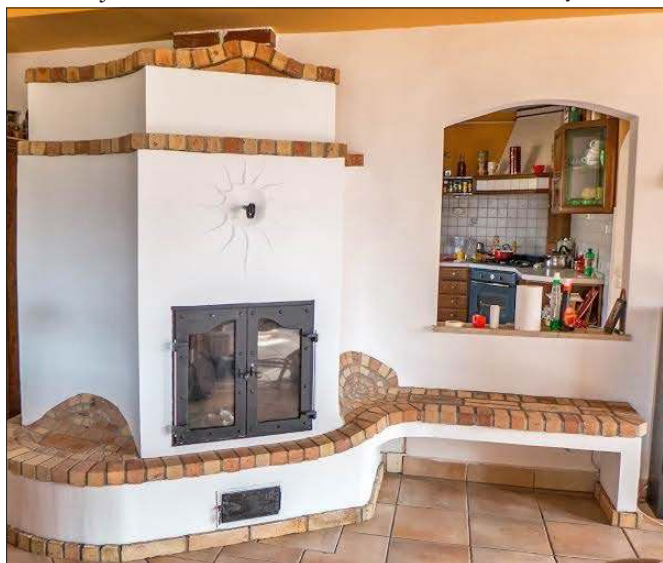
Az egyik kedves munka eredménye Rácalmásban