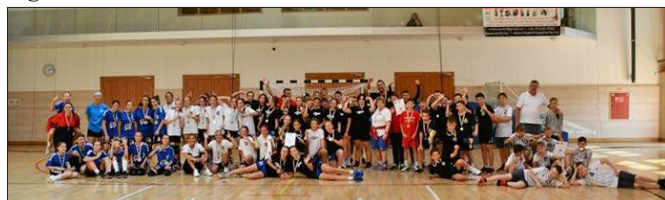
Az Ongai Kupán résztvevő csapatok