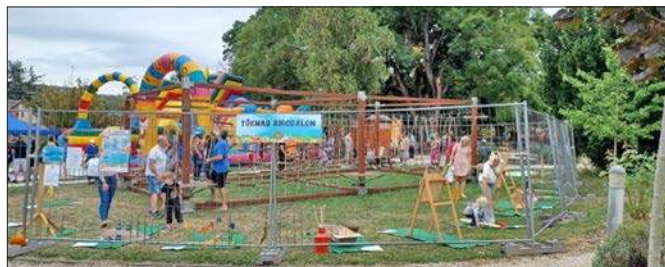
XIX. Rácalmási Tökfesztivál – Tökmag Birodalom