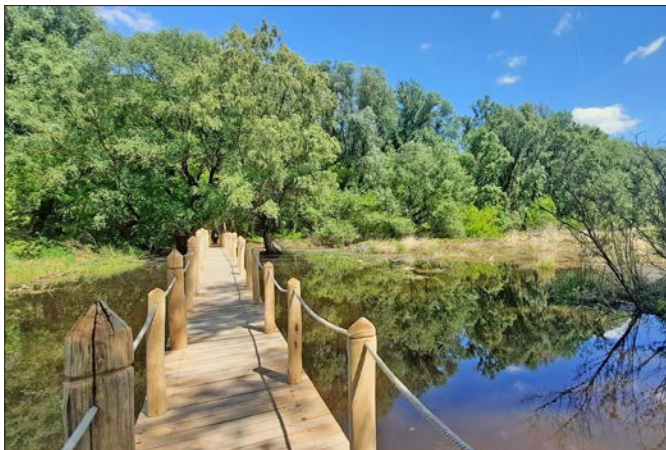
A Bürühíd már a nyár elején elkészült, ezen átkelve lesétálhatnak egészen a Duna főágának a partjáig