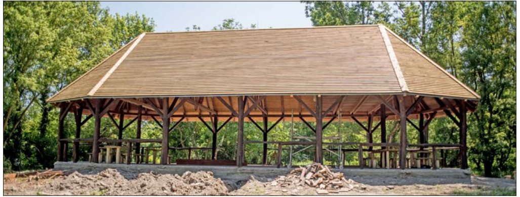
A fogadóépületet hamarosan birtokba vehetik a kirándulók, túrázók

A Rácalmási-szigetek ma már természetvédelmi terület. A védetté nyilvánításnak egyik legfontosabb célja az volt, hogy a gyönyörű tölgy-, kőris- és szilfa növényársulásokat megóvja az új, idegenhonos agresszívabb fajtáktól. Sűrű lombkoronájuk ellenére a ligeterdők cserje-