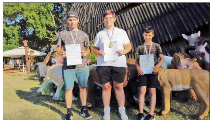
Bajnokként tértek haza a 3D országos verseny döntőjéről