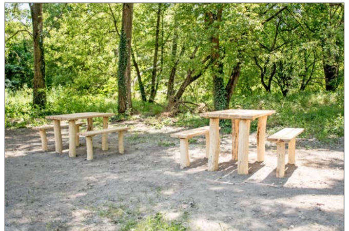
Asztalok melletti padokon pihenhetnek meg, fogyaszthatják el a túrára hozott elemőzsiájukat