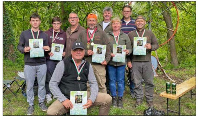
Rangos helyezéseket értek el a fogtői versenyen