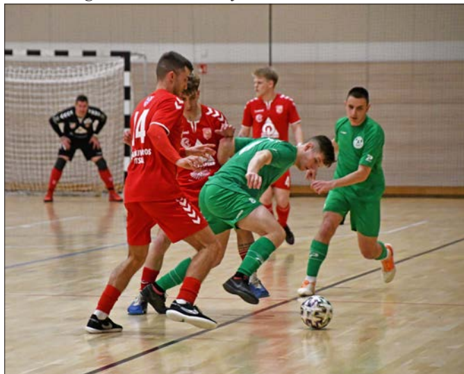
Dunaújváros Futsal-Tihanyi FC

Véget ért a magyar Futsal NB II-es bajnokságban az alapszakasz, és a rájátszás időszakába léptünk, az elmúlt hónapokhoz hasonlóan, női és férfi ágon is zajlanak folyamatosan a bajnoki mérkőzések, és mind a DPASE-Sárkeresztes női csapat, mind a Dunaújváros Futsal férfi csapat győzelmeiket tudhat magáénak a nálunk zajló hazai mérkőzéseken!