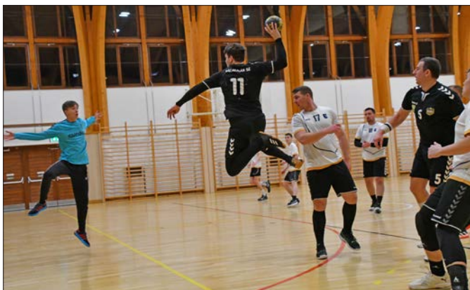
RSE-Cunder férfi kézilabda bajnoki mérkőzés

Március hónapban a kézilabda szakosztály, szinte minden korosztálya játszott hazai mérkőzést, mérkőzéseket a sportcsarnokban. Hazai pályán kiemelkedően szép sikereket értek el az utánpótlás csapatok és a felnőtt csapatok is! Csak így tovább, Hajrá Rácalmás! Hajrá Kézilabda!