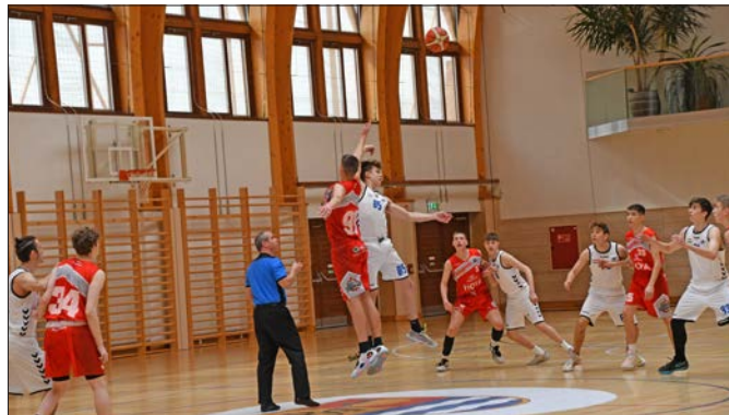
Dunaújvárosi Draons U-18-as korosztálya

A Dunaújvárosi Sárkányok Kosárlabda Egyesület, időről időre igénybe veszi küzdőterünket, kosárlabda bajnoki mérkőzéseik megrendezéséhez! Nagy örömünkre szolgál, hogy egy ilyen üde színfolt, mint a kosárlabda is zajlik intézményünkben!