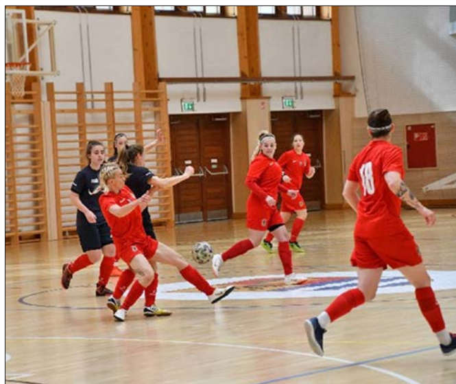
DPASE-Sárkeresztes női NB II. futsal