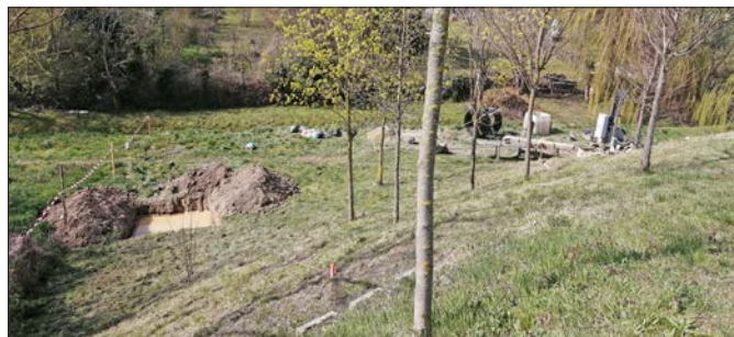
A munkaterületet lezárták

A Rácalmási Rendezvényközpont és Sportcsarnok mögötti területen, a Barina-patak partján, 2023. április 3-án kezdetét vette a sportcsarnok geotermikus hőellátó rendszerének kialakítása, így a munkaterületek lezárásra kerültek. Kérjük a lakosok szíves megértését és türelmét a kivitelezési munkálatok idejére.