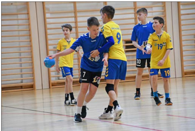
RSE FU-12 bajnoki forduló