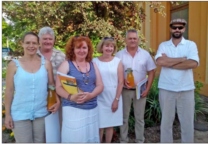
Az értékelő bizottság tagjai

Manóvár Óvoda, közösségi tér és szalagágyak, temető, sportpálya, Somogyi B. út, Bajcsy-Zs. és Kossuth