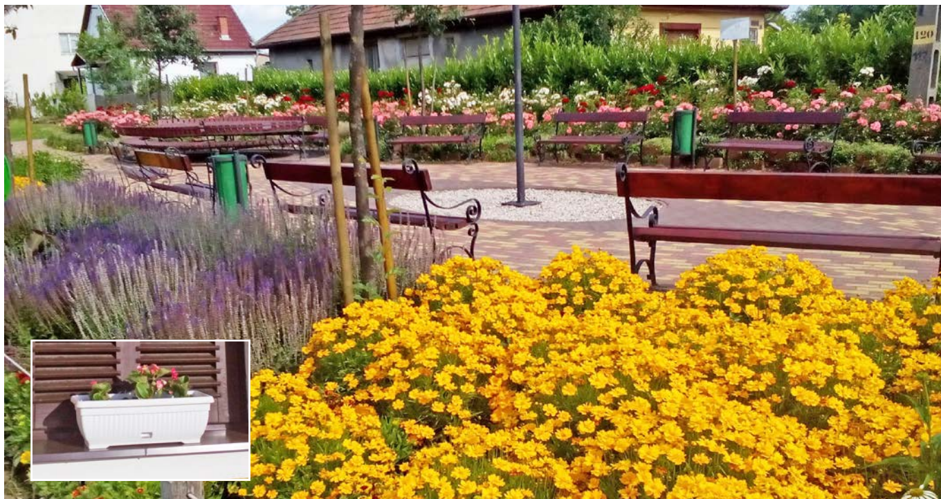
Közösségi tér és a szalagágyak újonnan ültetett virágai és a vasútállomás virágládái (kis képen)