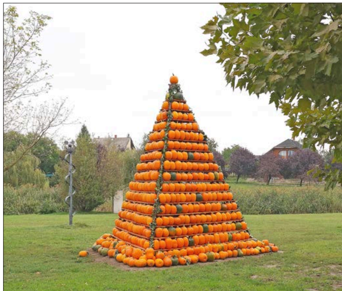
A városvédők révén megújult a tökpiramis tartószerkezete is az idei fesztiválra. Szép lett a kompozíció