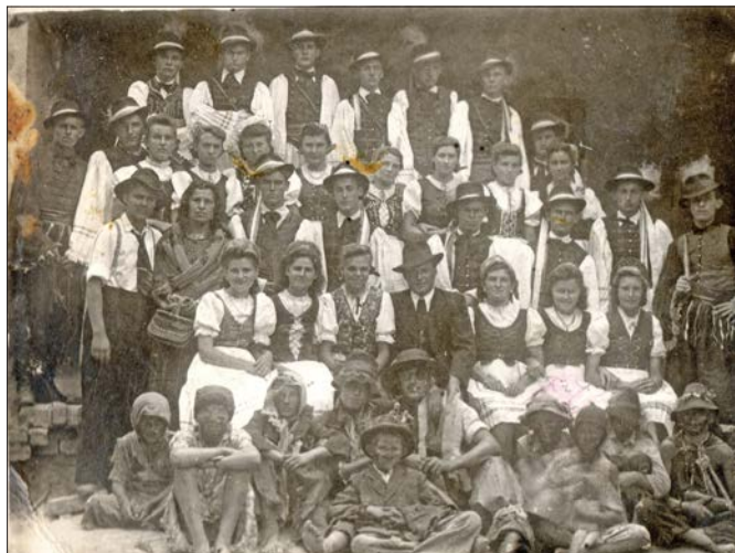
Szüreti bál Rácalmásban