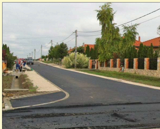
Elkészült az aszfaltozás a Hold és a Csillag utcában. A lakók régi vágya teljesül azzal, hogy jó minőségű úton közlekedhetnek

Az önkormányzat vezetői remélik, hogy a diákok örömmel veszik birtokba az ősszel a megújult tanteremeket, valamint a kétfélmillió forintot érő új felszereléseket.