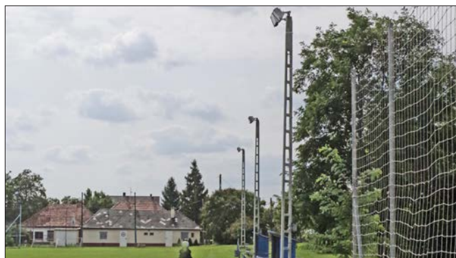
A TAO és az önkormányzat segítségével alakítottuk ki idén a focipályán a világítást