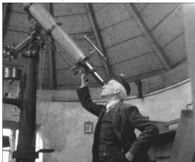
Posztoczký Károly csillagdájában

Posztoczký Károly Csillagda és Múzeum honlapja Interneten talált anyag