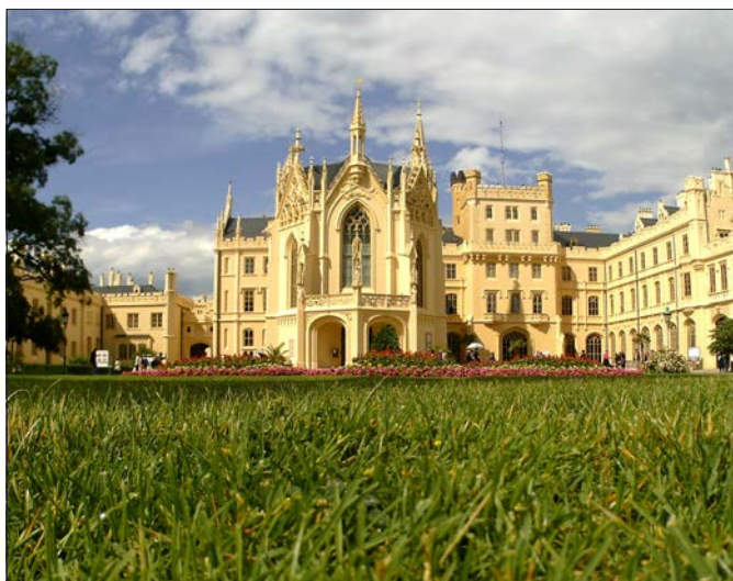
A világorökséggé nyilvánított Lednice kastélynak szintén pazar kertje és csodás pálmaháza is van