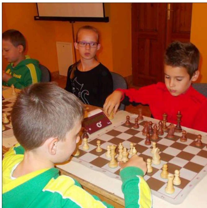
Sakk: a partik szünetében csocsóztak is