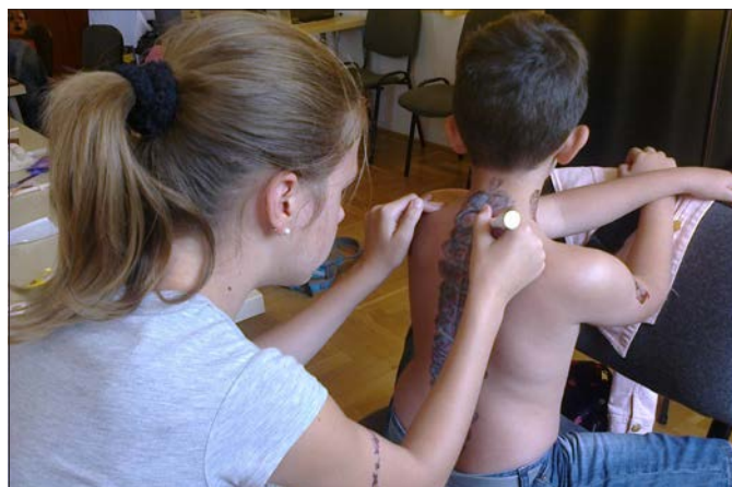
Angol: érdekes feladatokat oldottak meg