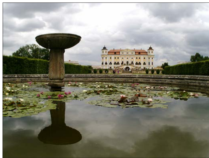
A Miloticei kastélyhoz hatalmas francia stílusú barokk díszkert tartozik természetesen az elmaradhatatlan szökőkúttal és a központ felé összefutó fasorokkal