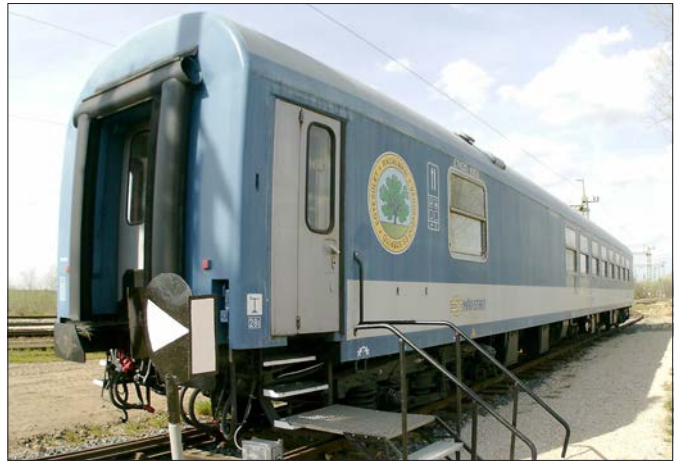
A felújított MÁV étkező kocs a vasútállomáson

métszedési akció keretében a városvédők harminc fős csapata május 9-én szombaton reggel 9-12 óra közt szemetet szedett többek közt az almavirág fesztiválra való felkészülés jegyében is.