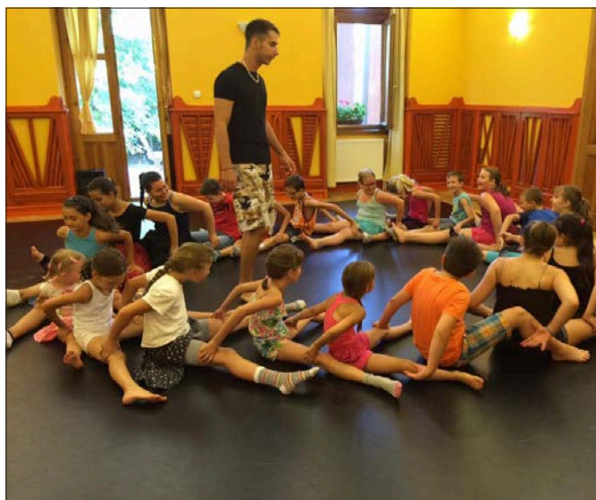
Néptánc: több mint húsz gyermek vett részt