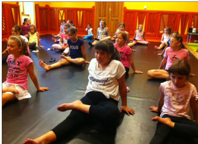
Jazz balett: megismerkedtek a jógával is