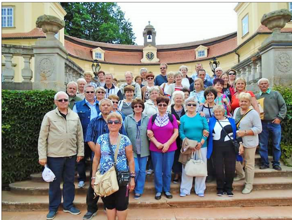
A rácalmási városvédő csapat a Buchkovice kastélyban