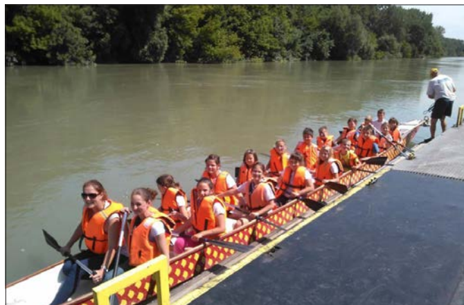
Kézilabda: más mozgásformákat is kipróbáltak