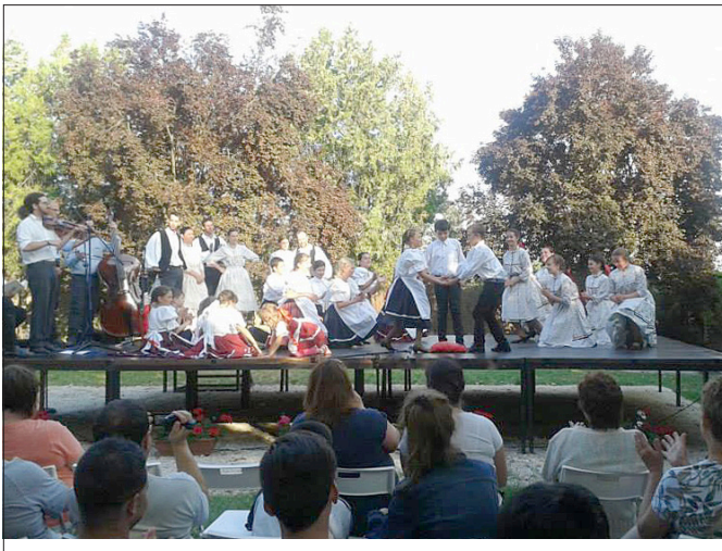
Egyszer volt, hol nem volt...