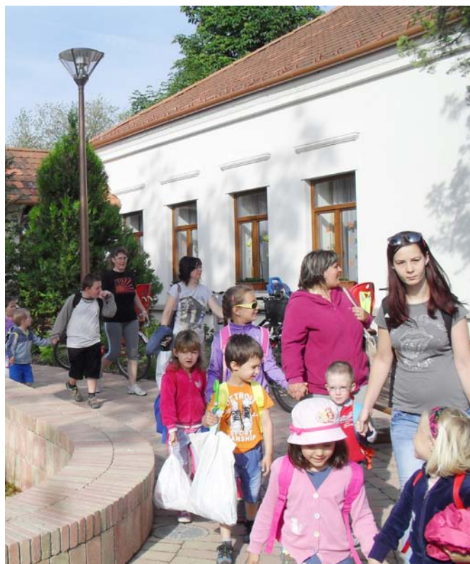
A Katica csoport indul az állatkertbe