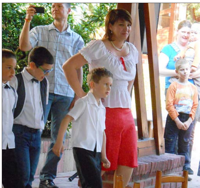
Hajni óvónéni szomorúan búcsúztatja ballagó nagycsoportosait

A tervezett új időpont: 2015. október 2. péntek.