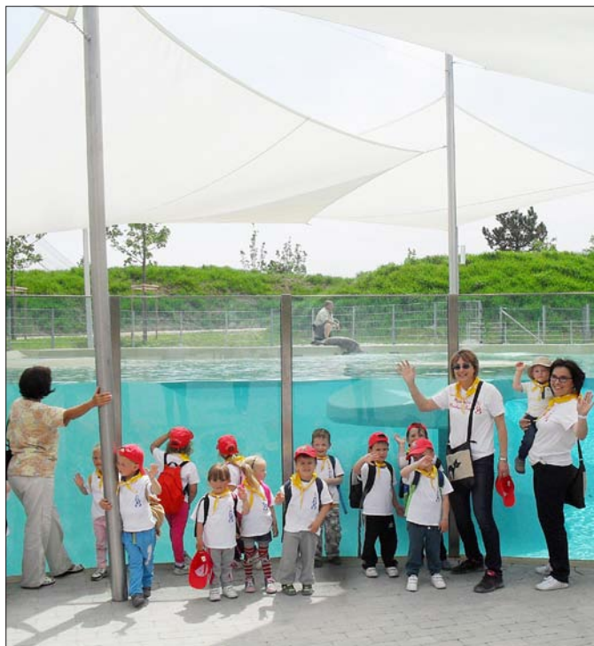
Óvodánk az idei tanévben a Veszprémi Állatkertbe látogatott el. Elvárásolta a felnőtteket, gyermekeket egyaránt a csodálatos környezet. Fáradtan, de sok kellemes élménnyel tértünk haza