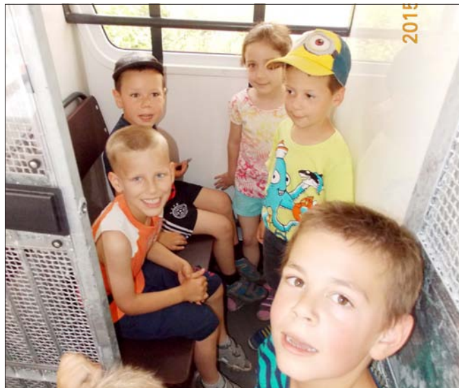
Köszönjük a rendvédelmi nap szervezőinek, hogy ilyen élménydús délelőttöt biztosítottak óvodásainknak. A gyermekek boldogan vették birtokba a rabszállító autót